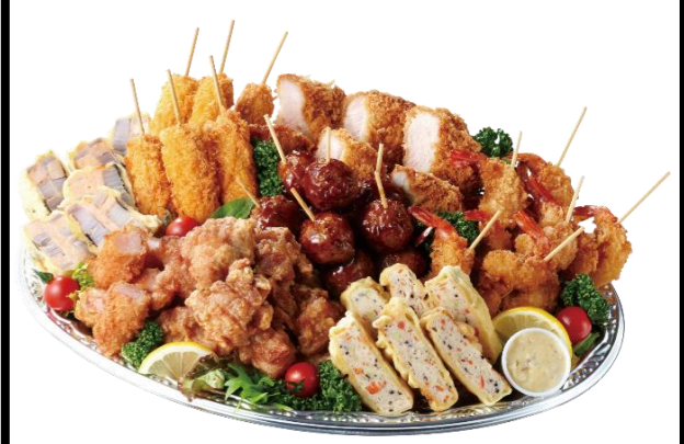
さくさくフライセット6人前 本体価格3,800円(税込4,104円)