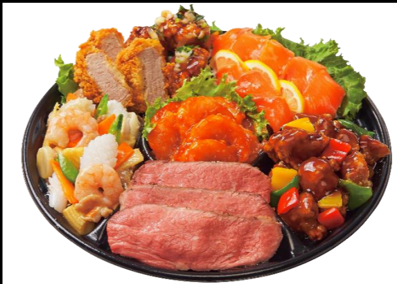
洋風・中華ミックスオードブル3人前 本体価格3,800円(税込4,104円)