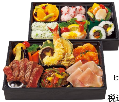
松阪牛 ヒレステーキ 御膳 税込11,880円