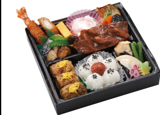
黒毛和牛贅沢すき焼き御膳 本体価格3,000円(税込3,240円)