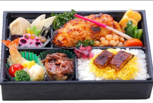
銀だらの西京焼き御膳 本体価格3,000円(税込3,240円)