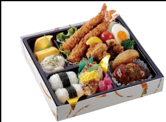
お子様幕の内弁当 本体価格1,500円(税込1,620円)