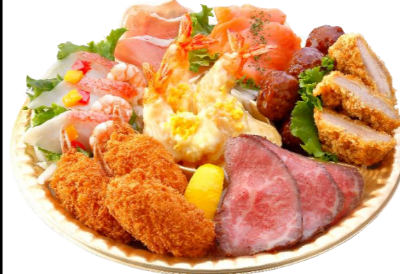
洋風オードブル3人前 本体価格3,800円(税込4,104円)