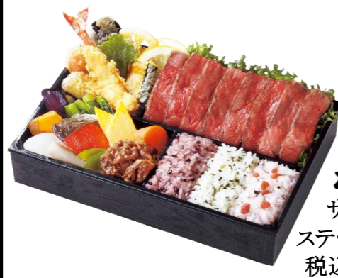
松阪牛 サーロイン ステーキ御膳 税込7,128円