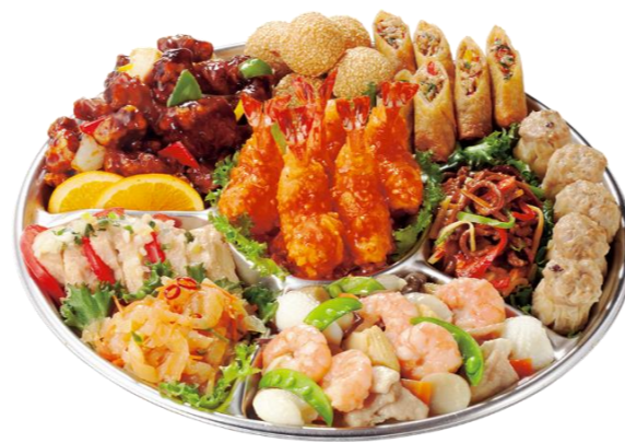
中華オードブル5人前 本体価格6,000円(税込6,480円)