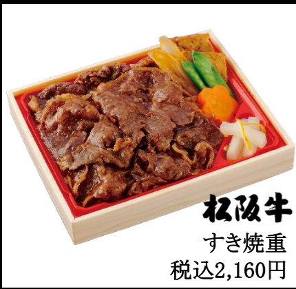
松阪牛 すき焼重 税込2,160円