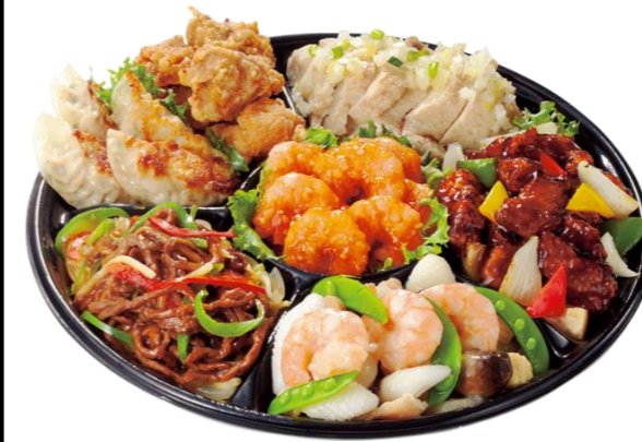
中華オードブル3人前 本体価格3,800円(税込4,104円)