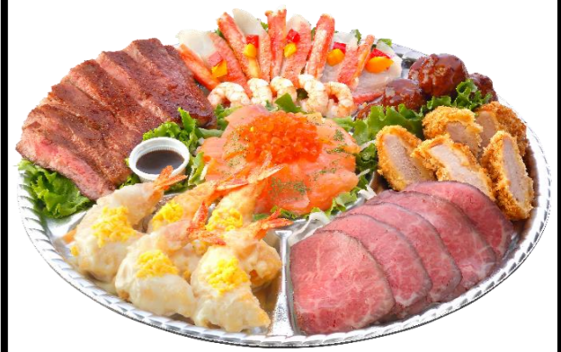
極オードブル5人前 本体価格11,500円(税込12,420円)