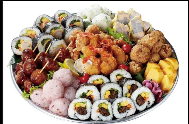
食べきりおにぎりセット6人前 本体価格4,300円(税込4,644円)