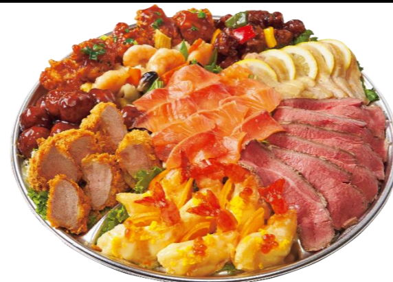
洋風・中華ミックスオードブル5人前 本体価格6,000円(税込6,480円)