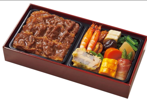
黒毛和牛牛めし御膳 本体価格2,500円(税込2,700円)