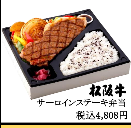
松阪牛 サーロインステーキ弁当 税込4,808円