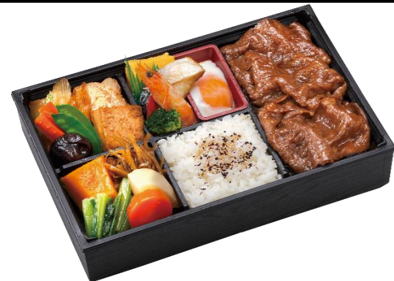
黒毛和牛すき焼き幕ノ内弁当 本体価格3,500円(税込3,780円)