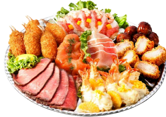
洋風オードブル5人前 本体価格6,000円(税込6,480円)