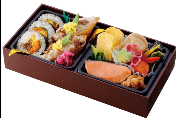
黒毛和牛彩り助六 本体価格2,000円(税込2,160円)