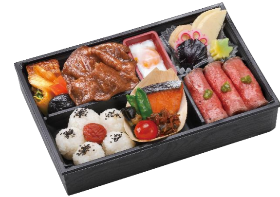
黒毛和牛すき焼きとローストビーフ御膳 本体価格3,500円(税込3,780円)